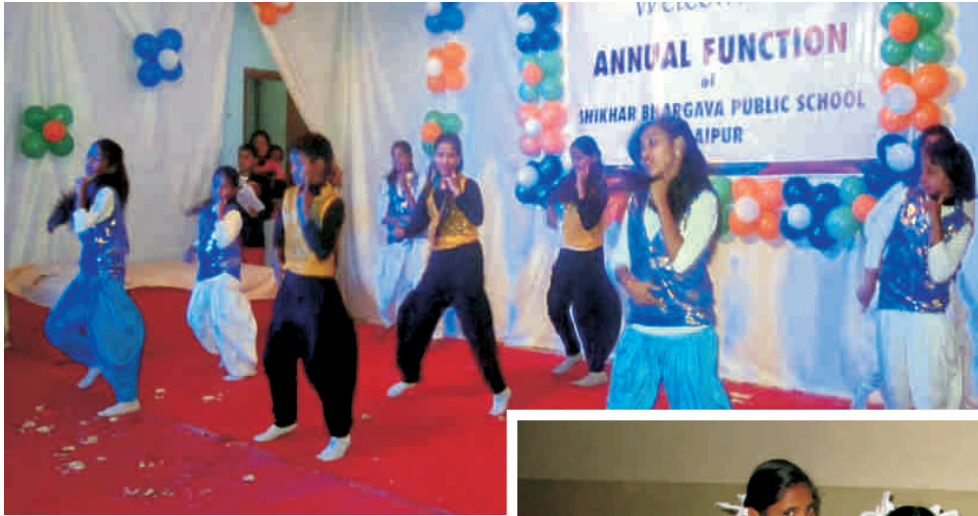
शिखर भार्गव पब्लिक स्कूल के वार्षिकोत्सव का एक दृश्य।