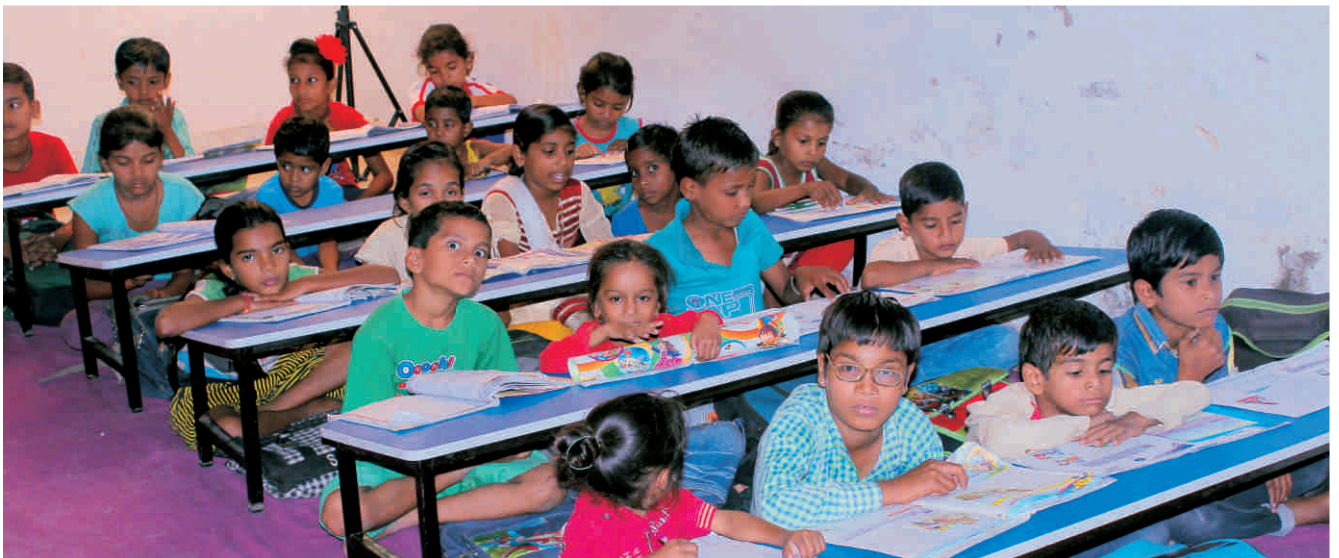
मस्ती की पाठशाला के गंभीर विद्यार्थीगण