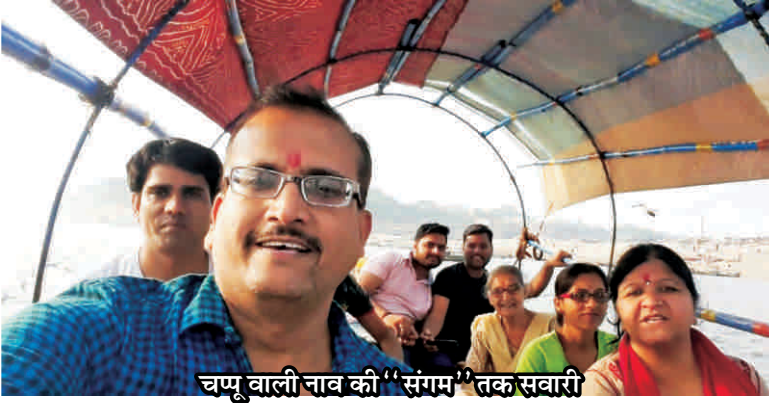
चप्पू वाली नाव की "संगम" तक सवारी