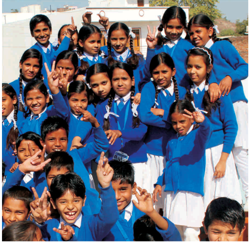
लंच ब्रेक में आनंदित विद्यार्थीगण