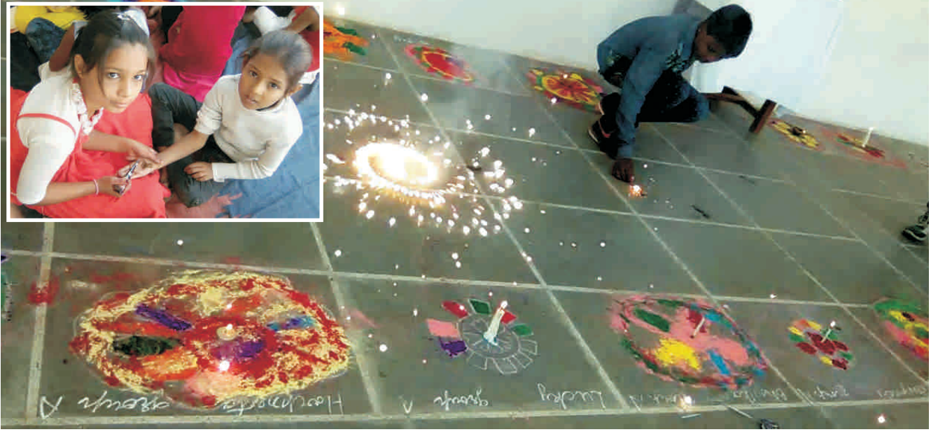
दीपावली के अवसर पर स्कूली बच्चे रंगोली आतिशबाजी और मेहंदी प्रतियोगिता में भाग लेते हुए।