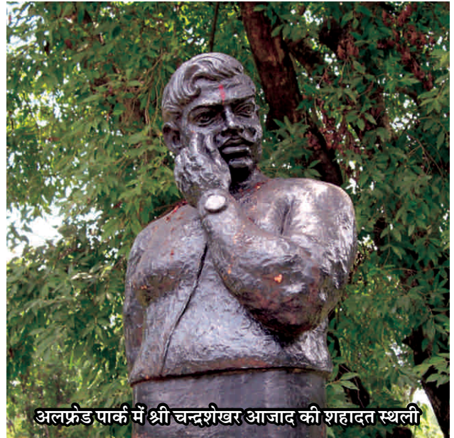
अलफ्रेड पार्क में श्री चन्द्रशेखर आजाद की शहादत स्थली