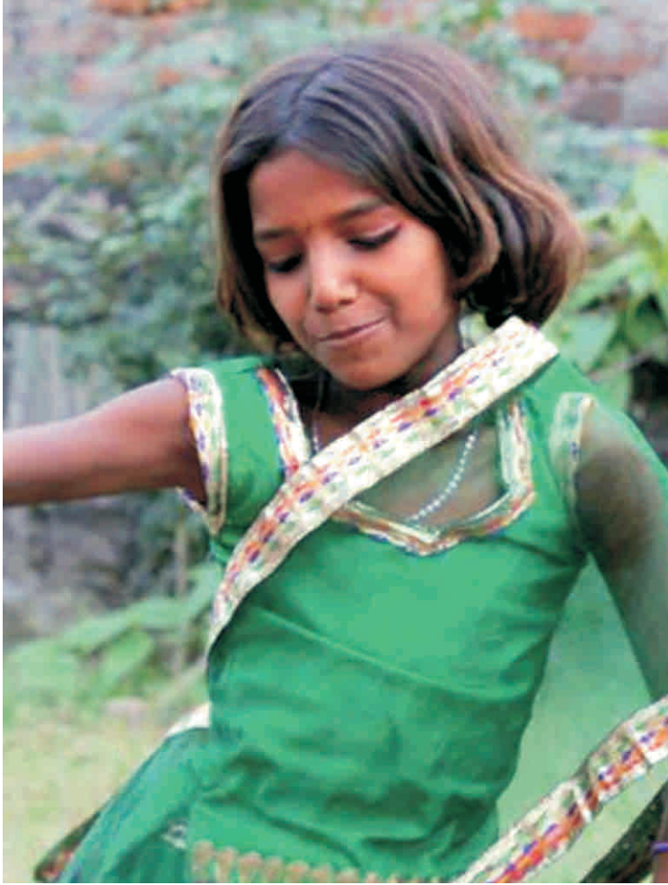
पाठशाला में एक बालिका नृत्य प्रस्तुति देती हुई